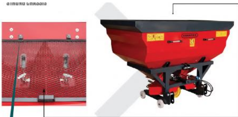
KOLAY AÇILABİLİR MENTEŞELİ ELEK SİSTEMİ EASY TO OPEN HINGED SIEVE SYSTEM